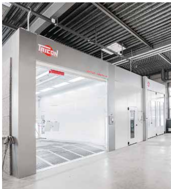
Auf Kundenwunsch lieferte die ESA je eine Multifunktions- und eine Lackierkabine von Tricon, die auch für grössere Nutzfahrzeuge geeignet sind.